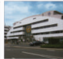
Lufthansa Flight Training Center