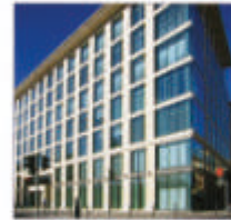
Bürogebäude Metzler am Main

Ruhberg 12 35463 Fernwald/Steinbach Telefon 06404 - 805-0 Telefax 06404 - 80515 www.kretz-wohl.de